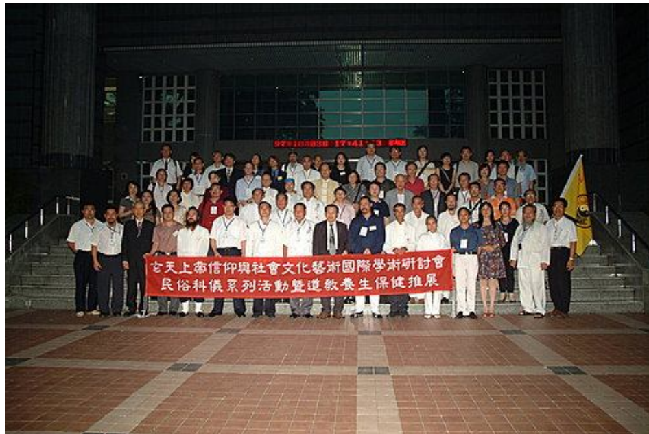
參加論文發表人員團體照