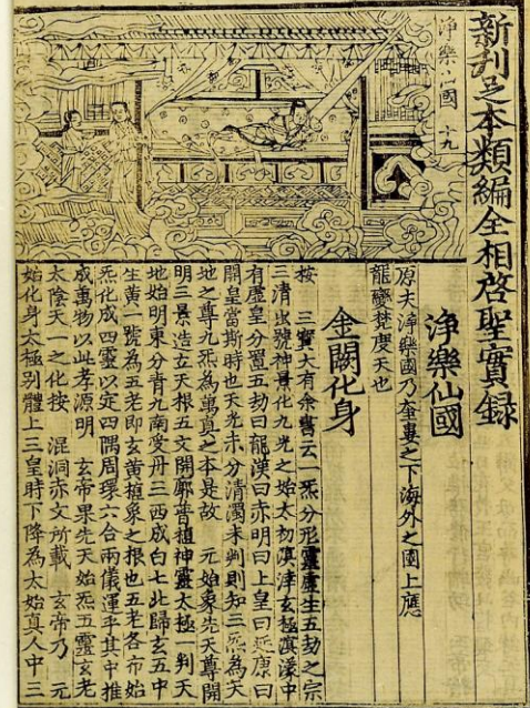
圖二 《大嶽太和山啓聖實錄》正文之一